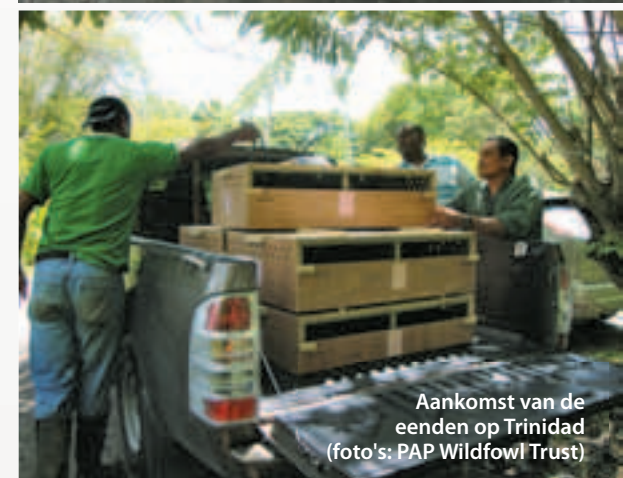
Aankomst van de eenden op Trinidad