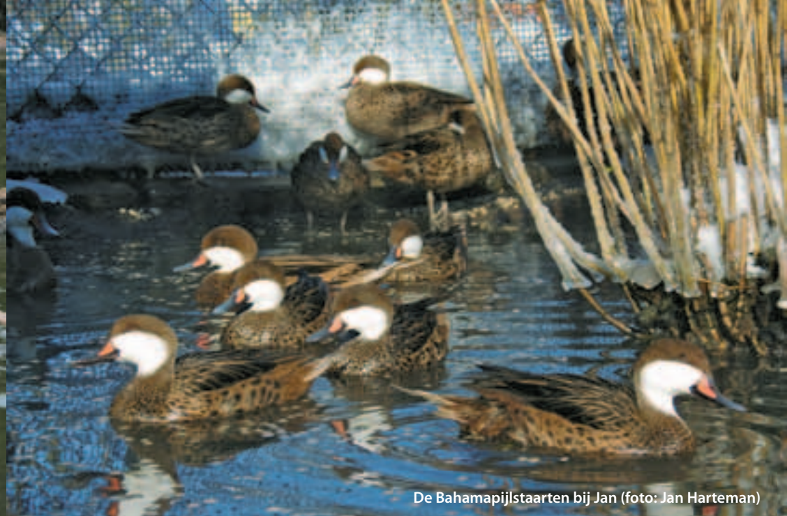
De Bahamapijlstaarten bij Jan

Weer thuis gekomen heb ik het plan voorgelegd aan mijn medebestuurders en deze waren unaniem enthousiast, waarmee het groene licht gegeven was. Na een aantal kwekers van watervogels gesproken te hebben kwamen er van diverse kanten spontane aanbiedingen om exemplaren van de witwangfluiteend en de Bahamapijlstaart beschikbaar te stellen. Eieren, kuikens en juveniele dieren werden ons geheel belangeloos aangeboden. Dit resulteerde uiteindelijk in een totaal van 60 vogels, fifty/fifty verdeeld over beide soorten. Het hadden er overigens veel meer kunnen zijn maar 60 dieren leek een behapbaar aantal, gelet op verzorging alhier, transport en uiteindelijke huisvesting in het land van bestemming. Ook uit onverwachte hoek kwam er hulp. Ik ontving een e-mail van Imre Nemes, de voorzitter van the National Bond of Hungarian Dove and Hobby Animal Keepers. Hij had gehoord van het project en bood spontaan vogels aan ten behoeve van het project.