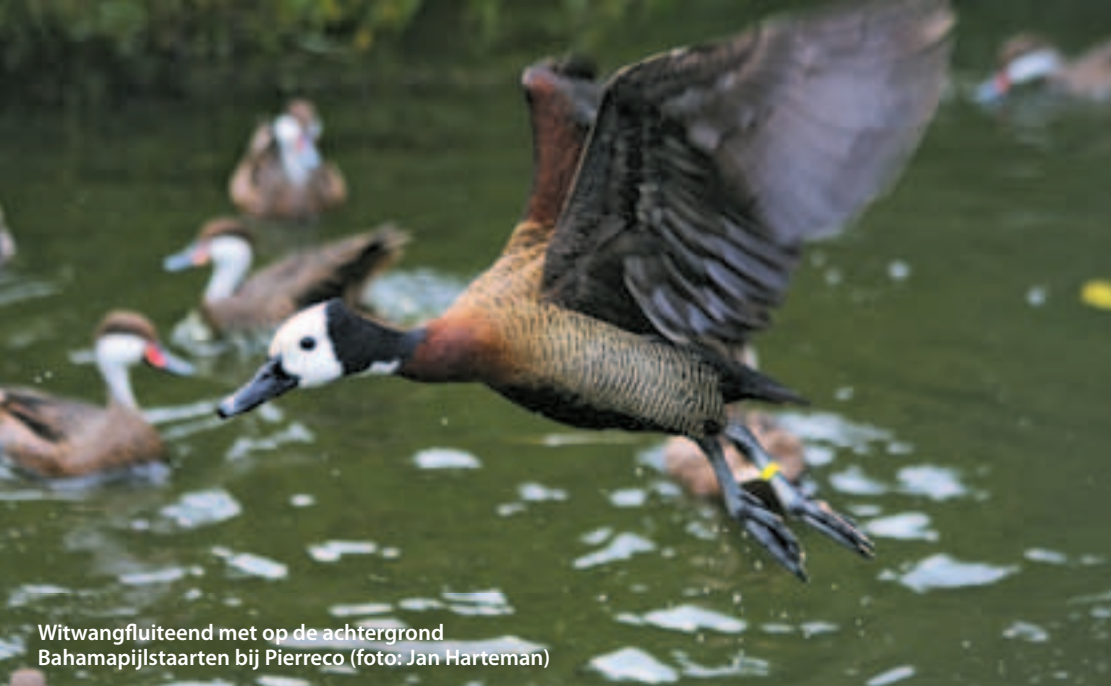
Witwangfluiteend met op de achtergrond Bahamapijlstaarten bij Pierreco

nachthok van mijn dwergflamingogroep. Ondanks het feit dat de buitenvijver door middel van stromend water niet geheel dichtvroom was het toch noodzakelijk om bij de langdurige sneeuwval de eenden binnen op te sluiten waar ze ook de beschikking hadden over stromend water. Toen kwam ook ineens het feit bovendrijven dat alle vogels geheel vliegvlug waren en daarmee niet zonder meer het nachthok in te drijven waren. Ik vrees dat daarbij nogal eens een krachtterm is geuit, mede omdat mij er alles aan gelegen was om de dieren allemaal gezond de winter door te krijgen. Het was natuurlijk mijn eer te na om de gulle gevers van de eenden te moeten mededelen dat er dieren door sneeuw en ijs hun paradijselijke bestemming niet gehaald zouden hebben.