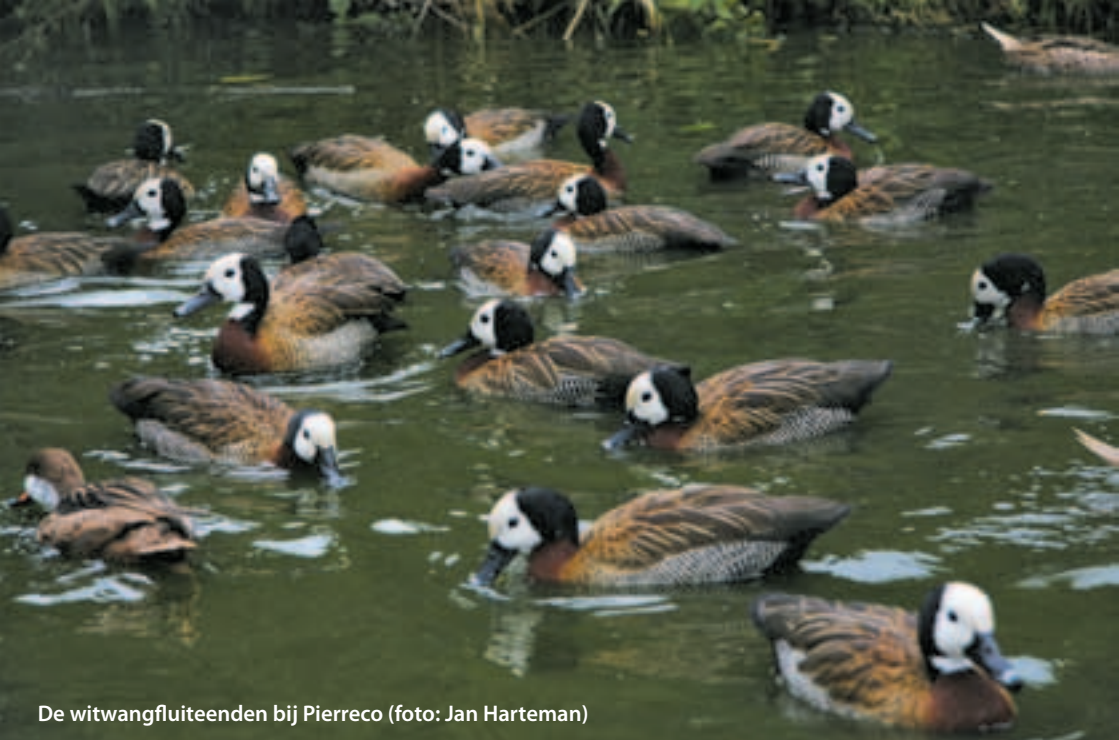
De witwangfluiteenden bij Pierreco